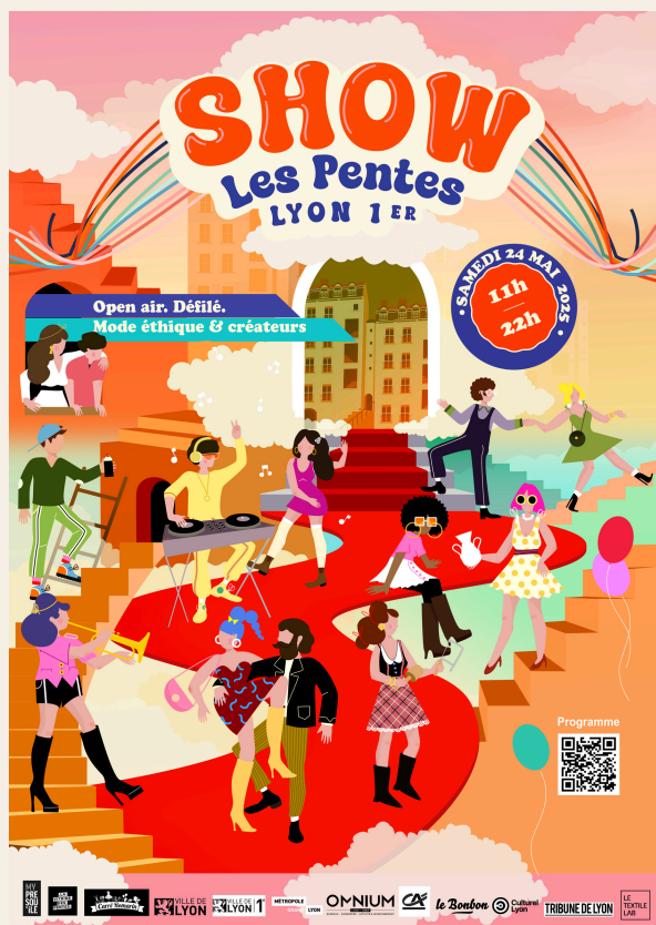
Illustration : @poppy-magda

L'événement arty, musical, mode éthique et créateurs : Show Les Pentes fait son retour le samedi 24 mai 2025 dans les Pentes de la Croix-Rousse, Lyon 1er ! Les associations My Presqu'île , La Vitrine des Pentes et Carré Romarin remettent le couvert pour une 2e édition encore plus festive.